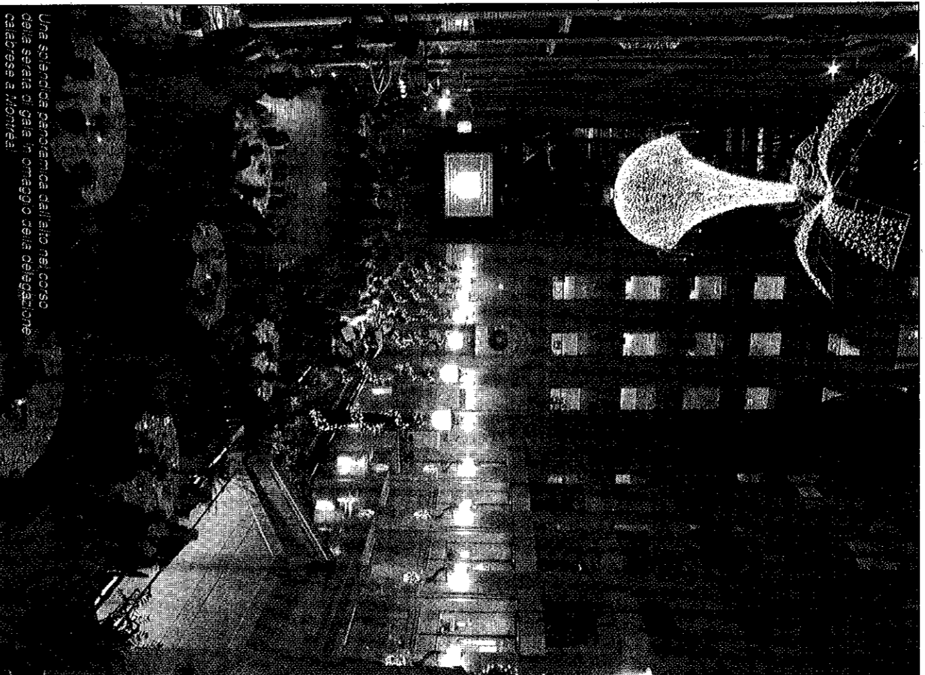
Una sponda panoramica dall'alto nel corso della serata di gala in omaggio della delegazione calabrese a Montréal.

Nello specifico, nel corso della visita nel Paese degli Aceri, con il prezioso supporto della Camera di Commercio italiana in Canada, si sono tenuti proficui incontri sul tema dell'energia da fonti rinnovabili, sulle tecnologie dell'informazione e telecomunicazione e sulle biotecnologie, nonché riunioni mirate con operatori nel campo della distribuzione commerciale ed artigianale, per capire quali possono essere i margini di collaborazione con il Canada, ed in modo particolare con il Québec. Dal canto loro, i rappresentanti delle imprese calabresi hanno sottolineato come già da subito si stiano concretizzando occasioni di business, in particolare nel settore agroalimentare, che potranno portare grandi benefici alla Calabria. Inoltre, molti imprenditori canadesi